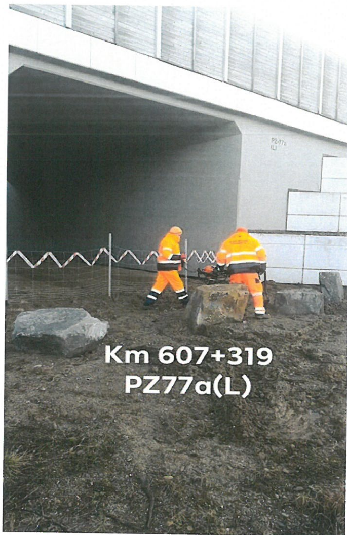
Km 607+319 PZ77a(L)