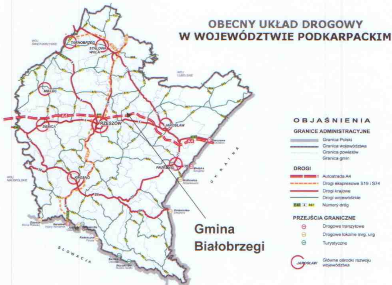
Mapa 3 Obecny układ drogowy w województwie podkarpackim