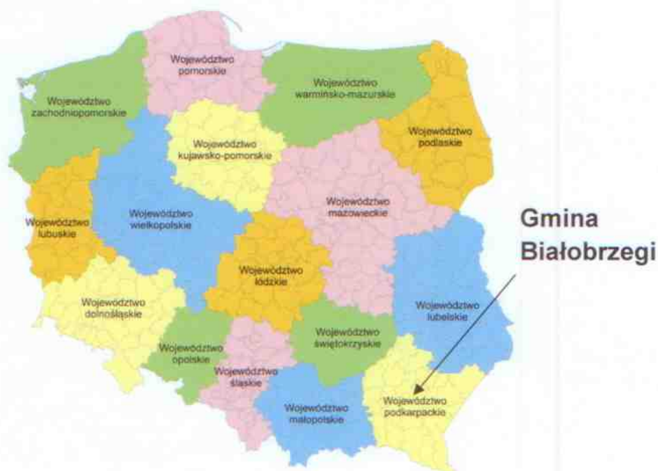
Mapa 1 Położenie Gminy Białobrzegi na tle Polski

Gmina Białobrzegi oddalona jest od ośrodków przemysłowych, posiada dobre warunki wypoczynkowe, piękny krajobraz i czyste powietrze. Rekreacyjne zaplecze gminy stanowi kompleks leśny w okolicach Korniaktowa Płn. Gmina leży w paśmie wzmożonej aktywności gospodarczej związanym z głównym kierunkiem komunikacyjnym o znaczeniu krajowym i europejskim z zachodu na wschód. Położona jest w sąsiedztwie linii kolejowej Medyka – Kraków, oraz w pobliżu międzynarodowej trasy E-4. Rozwinięta sieć dróg gminnych, powiatowych i wojewódzkich umożliwia dobrą komunikację z okolicznymi miastami tj. Łańcutem, Leżajskiem, Przeworskiem oraz Rzeszowem. Plan budowy autostrady przewiduje jej przebieg przez teren gminy, przecinając ją wzdłuż na odcinku około 17km.